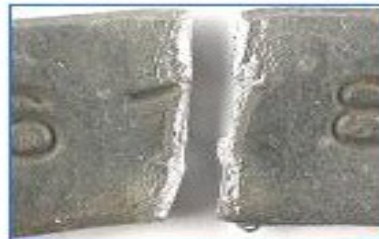
Bruchverlauf durch Ziffern- einprägung begünstigt

Kein Riss oder Bruch verläuft genau wie der andere!